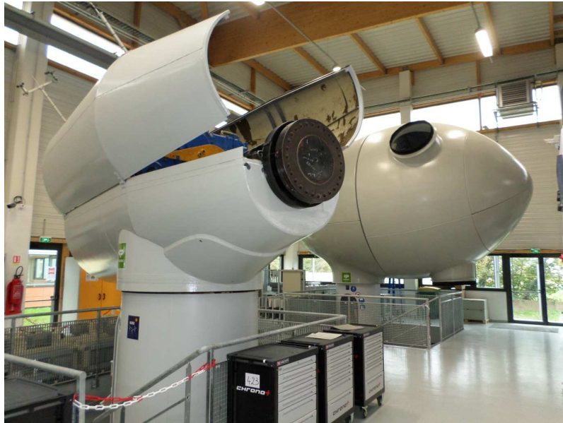
Nacelles de la plateforme de formation WindLab à Amiens : 30 personnes formées/an à la maintenance des parcs éoliens (taux d'embauche de plus de 85%)

Le maître d'ouvrage accompagne en outre le projet d'un développement des compétences des futurs travailleurs du parc et des usines (315 000 heures de formation prévues).